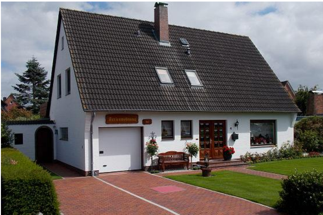
Bewertungsbeispiel Objekt: Einfamilienhaus in 40474 Düsseldorf Verfasser: